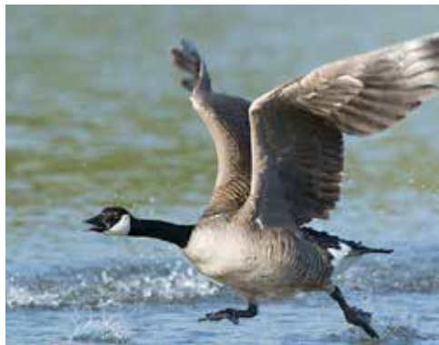
Grote Canadese gans

En de soort die echt oprukt – zoals overall in onze regio – is de grote Canadese gans . Die lijkt het vooral naar zijn zin lijkt te hebben op de Rijswijkse golfclub. Verder laveren ze vaak tussen de roeiboten in het Rijn-Schiekanaal. Bij deze club vliegt op 29 juni een zwarte wouw over en ook de sperwer en