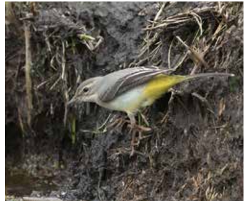
Grote gele kwikstaart

zanger ter plekke. Deze broedt in moerasige taiga in het hoge noorden en heeft doorgaans een heel andere trekroute want de soort overwintert in Noord-India en Zuidoost-Azië. Diezelfde dag ook 47 grote sterns en 52 boeren- en 17 huiszwaluwen. Weer een dag later: reuzensterne, dwergmeeuw en zwartkopmeeuw, 23 roodkeelduikers, 178 veldleeuweriken, 'slechts' 671 graspiepers en