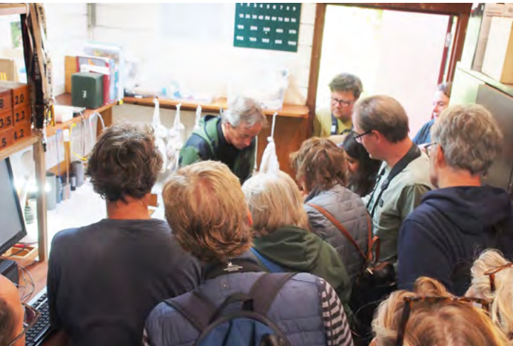
Grote belangstelling voor de excursie naar het ringstation Meijndel

eindigde bij het Prins Hendrikzanddijkgebied. In totaal werden 61 soorten waargenomen, waaronder rosse grutto, rotgans en grote stern. Een koningseider werd helaas niet gevonden.