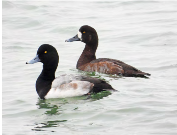
Toppers tijdens de excursie naar IJmuiden

Een winterse excursie naar de Zuidpier van IJmuiden. Er was veel vis en dat resulteerde in spectaculaire waarnemingen. Grote aantallen jan-van-genten foerageerden tussen de pieren en ook aalscholvers waren massaal aanwezig. Op en langs de pier werden o.a. oeverpiepers, drieteenstrandlopers, steenlopers en paarse strandlopers gezien. Op zee zwommen onder meer toppers, zwarte zee-eenden en eiders. Hoogtepunten waren vijftien zeehonden - zowel gewone als grijze - en meerdere bruinvissen. Een zeer geslaagde en indrukwekkende afsluiting van het excursiejaar.