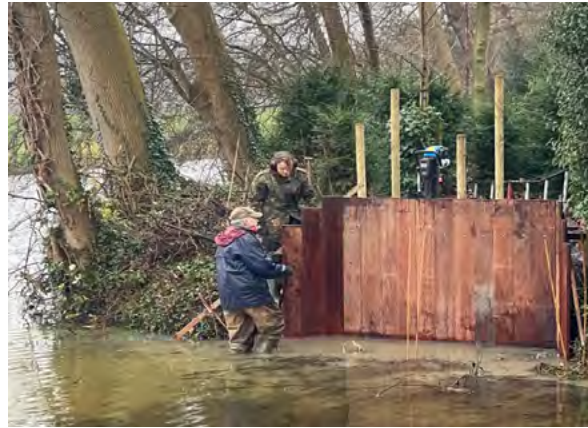
Trots op het resultaat