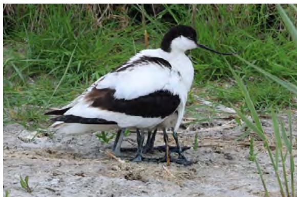
Kluit met jongen