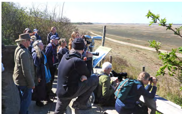
Deelnemers tijdens een van de excursies